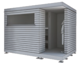
Nido mit Vorraum